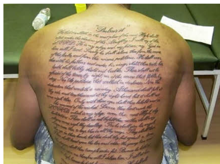
In acht Stunden bekam dieser Kunde Psalmen unter die Haut gestochen.