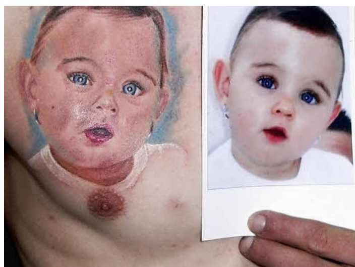
Andere lassen sich ihr Kind vom Foto auf die Haut bannen.